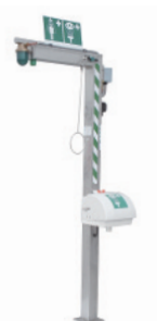
BR 818 795

Подключение к сети водоснабжения: внутренняя резьба 1 1/4" Подключение к электросети: 230 В – 50 Гц Вылет: 600 мм Общая высота: 2300 мм