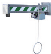
BR 819 795

Подключение к сети водоснабжения: наружная резьба 3/8" Водослив: 1 1/4" Подключение к электросети: 230 В – 50 Гц Габаритные размеры (В x Ш x Г): 285 x 355 x 305 мм