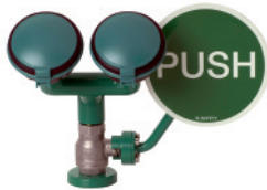
BR 200 085

ClassicLine safety eye shower with two spray heads 45°, table mounted Аварийный душ для глаз «ClassicLine» с двумя душевыми насадками 45°, для монтажа на столе