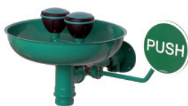
BR 300 085

Подключение к сети водоснабжения: внутренняя резьба 3/4" Общая ширина, включая рукоятку: 240 мм Вылет: 330 мм