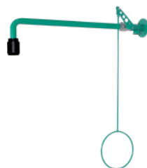
BR 082 085

Прочие варианты поставки: BR 081 075: латунь, порошковое напыление красного цвета BR 081 095: высококачественная сталь, полированная