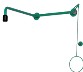
BR 084 085

Прочие варианты поставки: BR 082 075: латунь, порошковое напыление красного цвета BR 082 095: высококачественная сталь, полированная