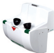
BR 826 095